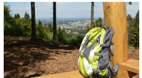
Blick Richtung Werther (Westf.)