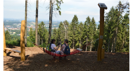
Wanderer in der Hängematte in Werther (Westf.)