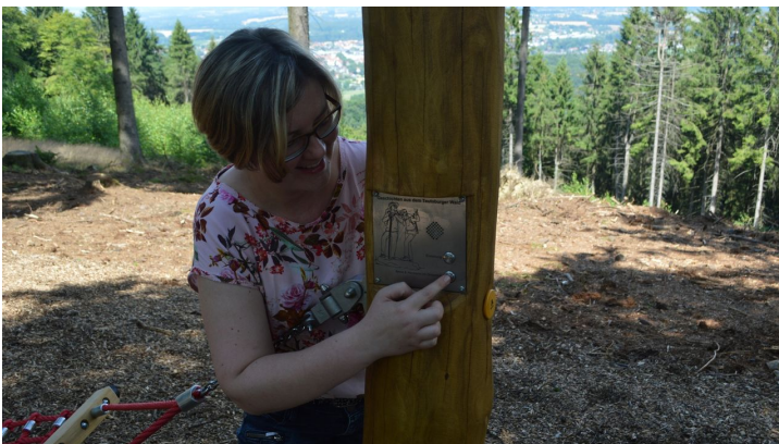
Bedienung der Hörstation "Anna und Hermann" in Werther (Westf.)