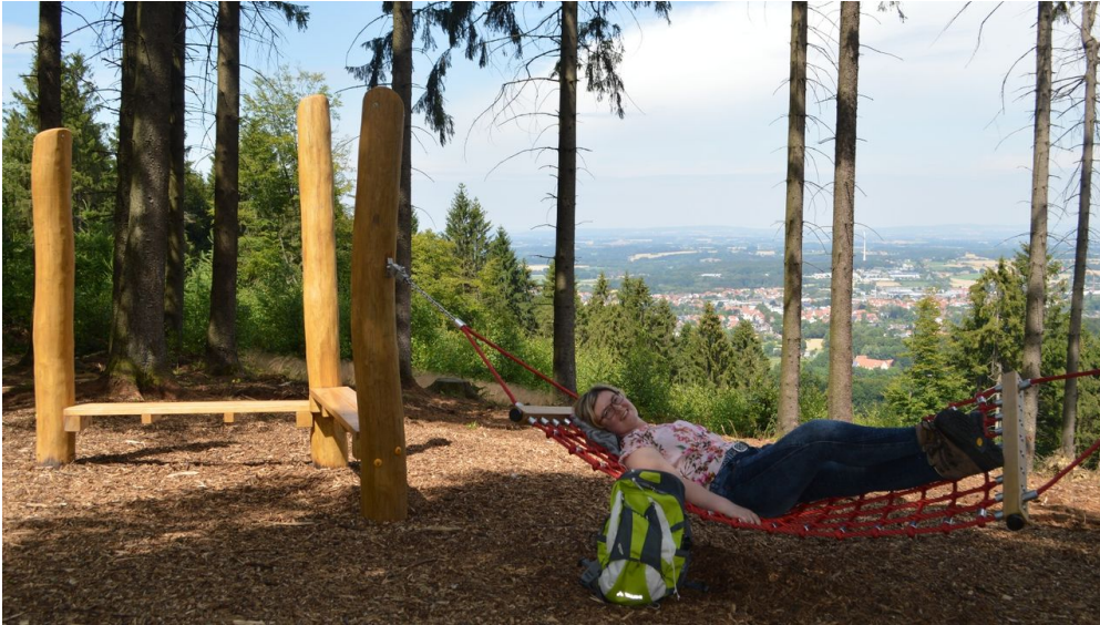
Gemütlich in der Hängematte über Werther (Westf.) - © Projektbüro Hermannshöhen, Teutoburger Wald Tourismus