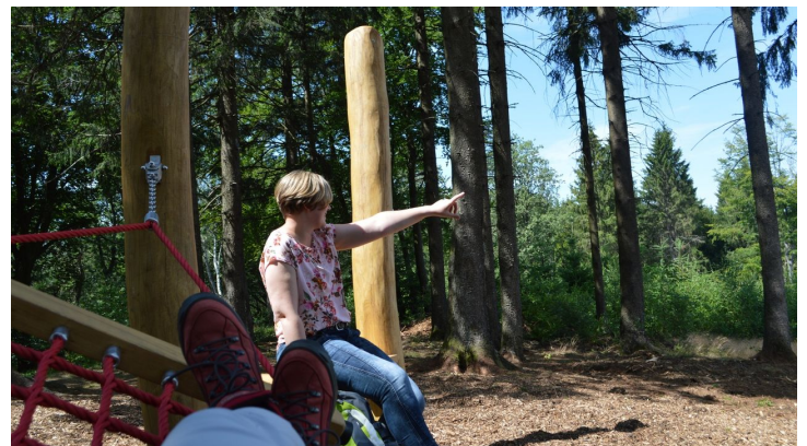
Blick aus der Hängematte in Werther (Westf.)