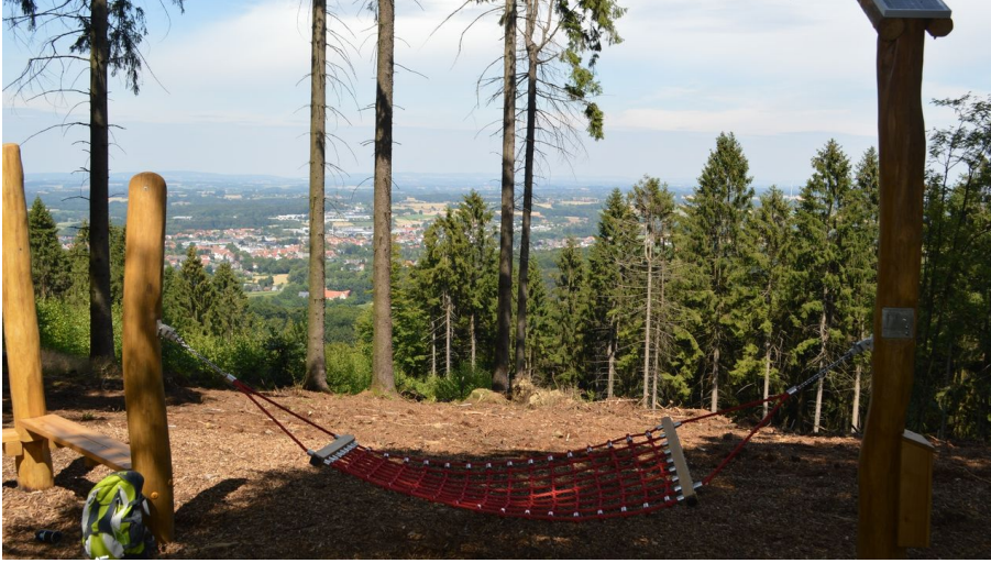
Rastplatz Hörstation "Anna und Hermann" in Werther (Westf.)