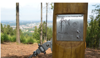
Hörstation am Rastplatz "Anna und Hermann" in Werther (Westf.)