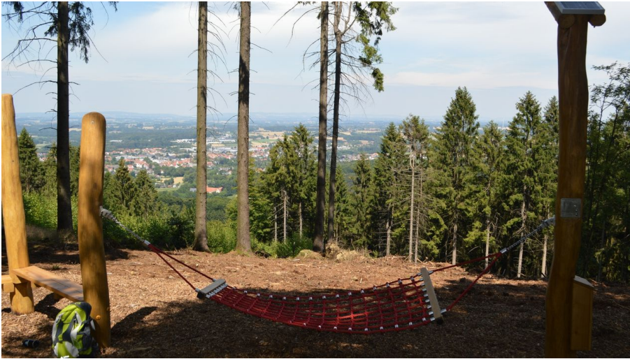
Rastplatz Hörstation "Anna und Hermann" in Werther (Westf.)