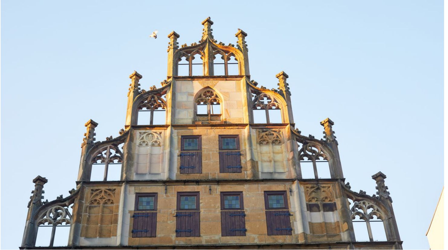
Bielefeld-Fassade-Alter Markt-Teutoburger-Wald-Tourismus-T-Evers-001-CC-BY-SA.jpg - © Teutoburger Wald Tourismus / T. Evers, Tanja Evers