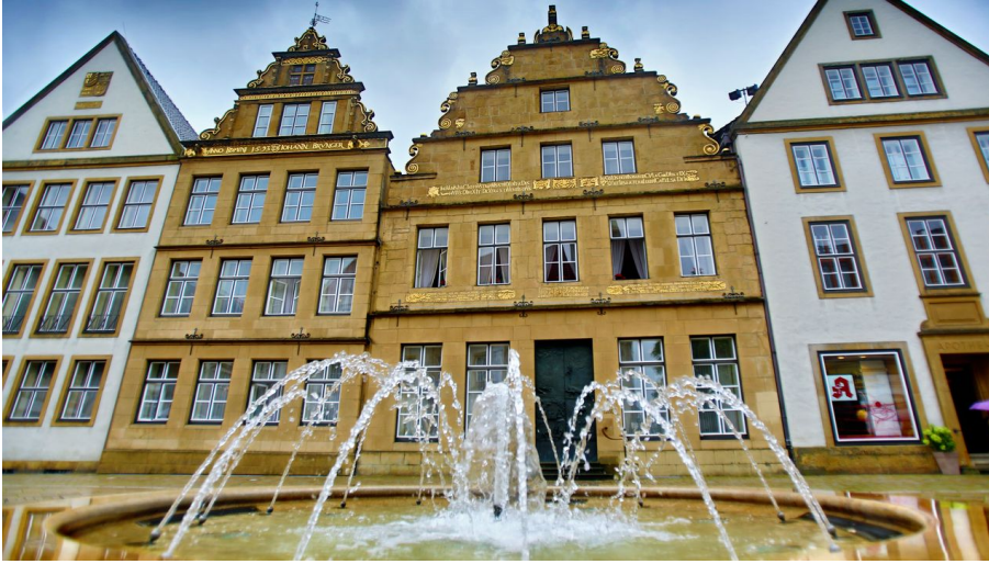
Alter Markt