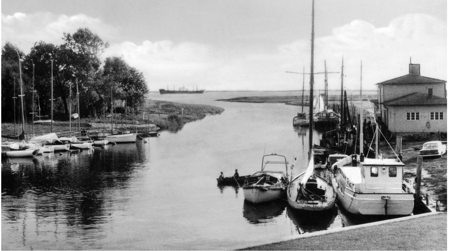
Alter Hafen Brunsbüttel