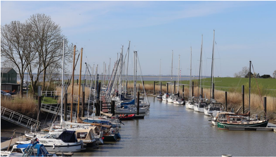
Alter Hafen Brunsbüttel - © Dithmarschen Tourismus