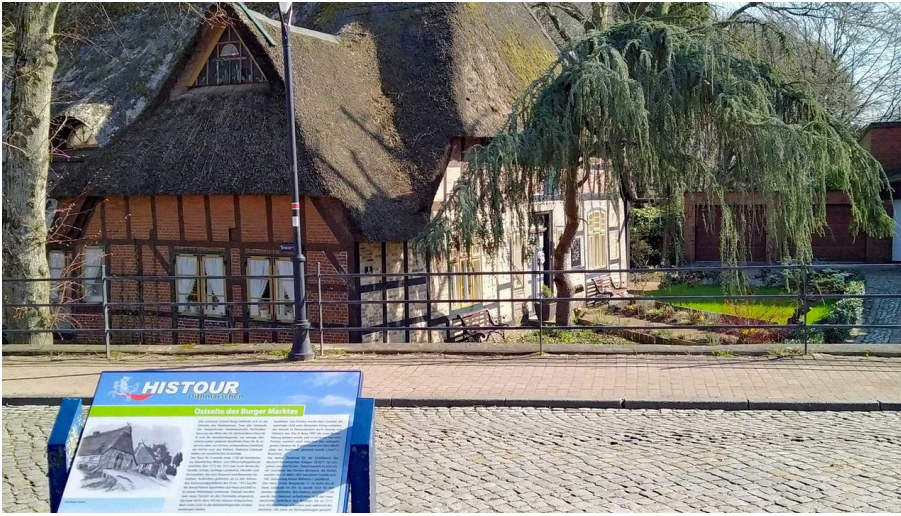
Ostseite des Burger Marktes