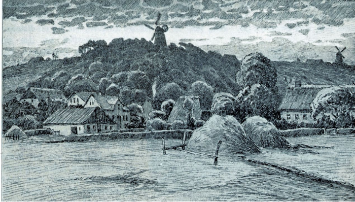
Ostseite des Burger Marktes

Das Haus Große Bergstraße 11 ist wohl das älteste Gebäude im Ort. Es wurde 1613 für den zweiten Geistlichen, den Diakon, errichtet. 1720 wurde das Diakonat aufgehoben und das Haus wechselte mehrfach den Besitzer, bis es 1771 vom Kirchspielvogt erworben und während der nächsten 100 Jahre als Kirchspielvogtei genutzt wurde.