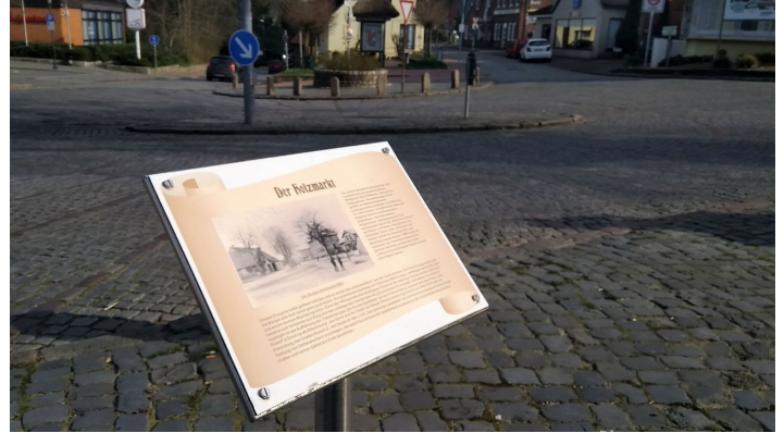
Ostseite des Burger Marktes