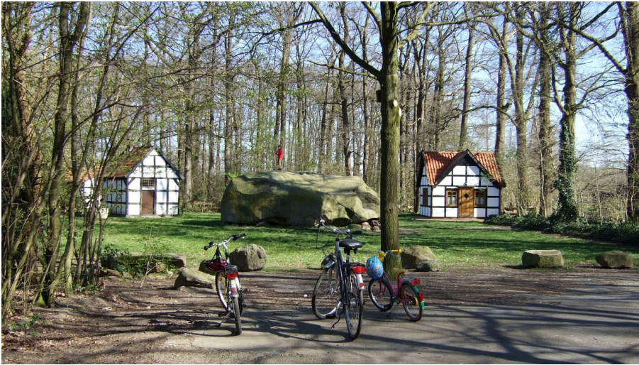
Großer Stein mit Backhaus