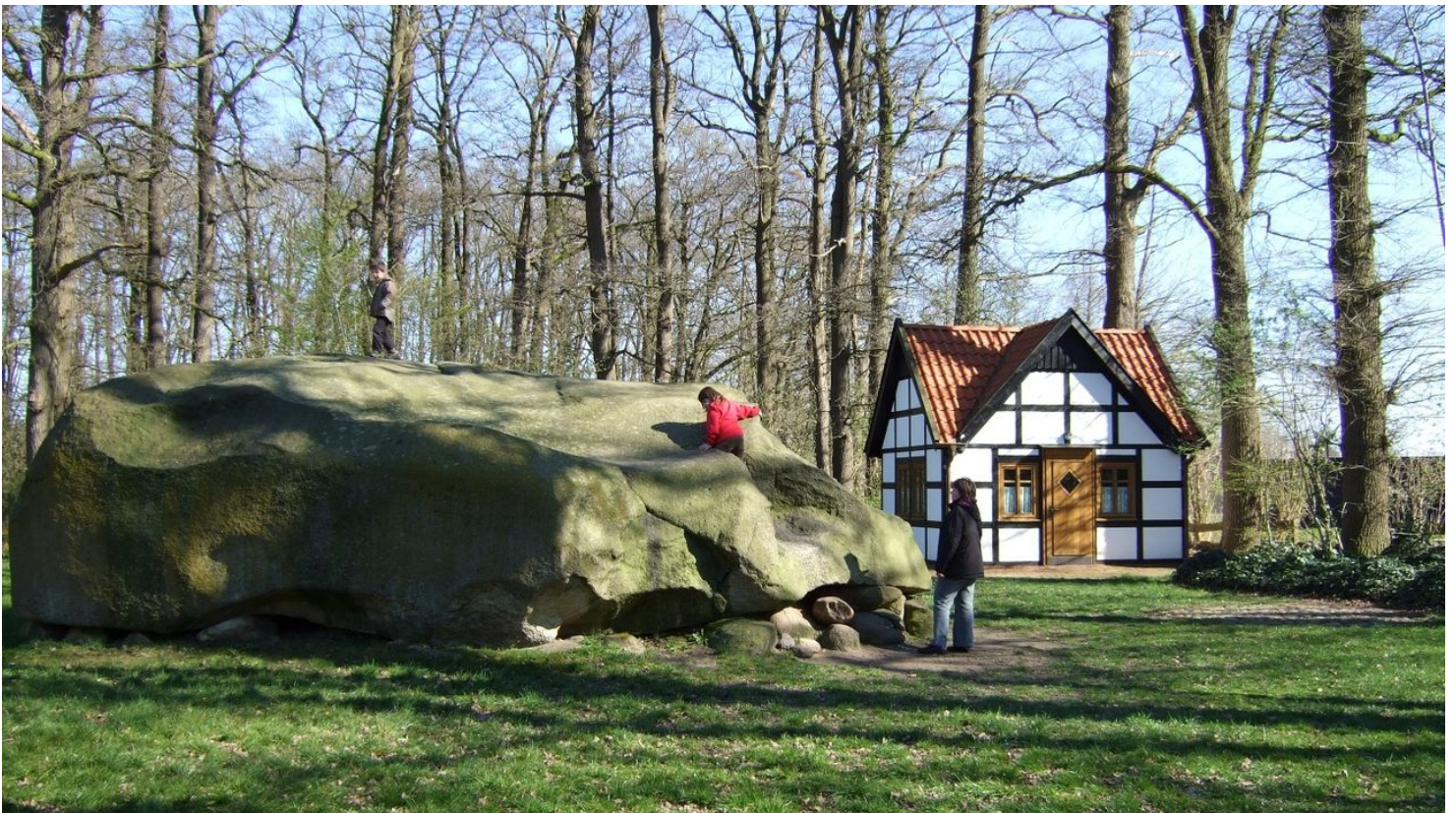
Großer Stein