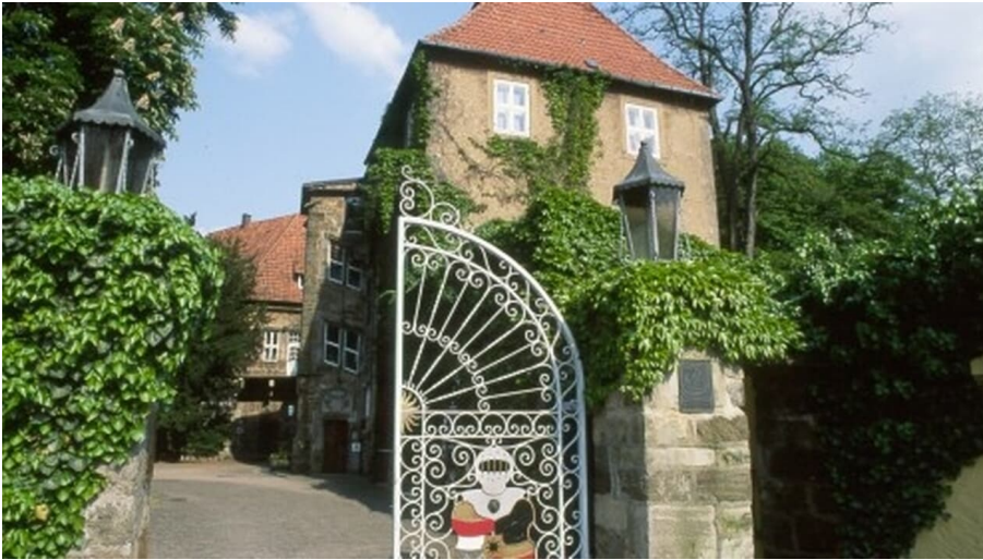
Schloss Petershagen