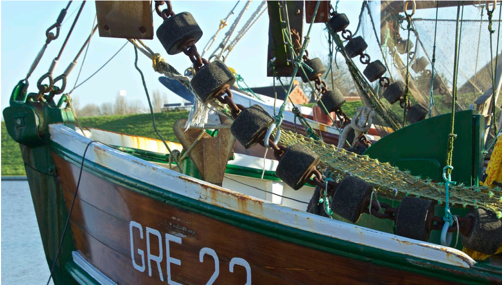
Hafen Greetsiel Kutternetz