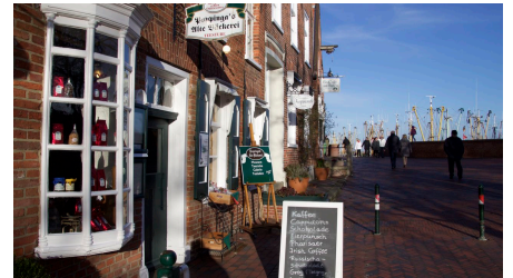
Hafen Greetsiel Häuserzeile