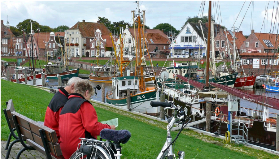
Hafen Greetsiel Radfahrer