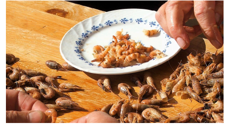
Hafen Greetsiel Krabben