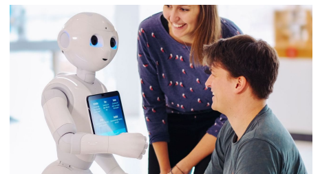
Der humanoide Roboter kommuniziert gerne mit den Gästen im phaeno