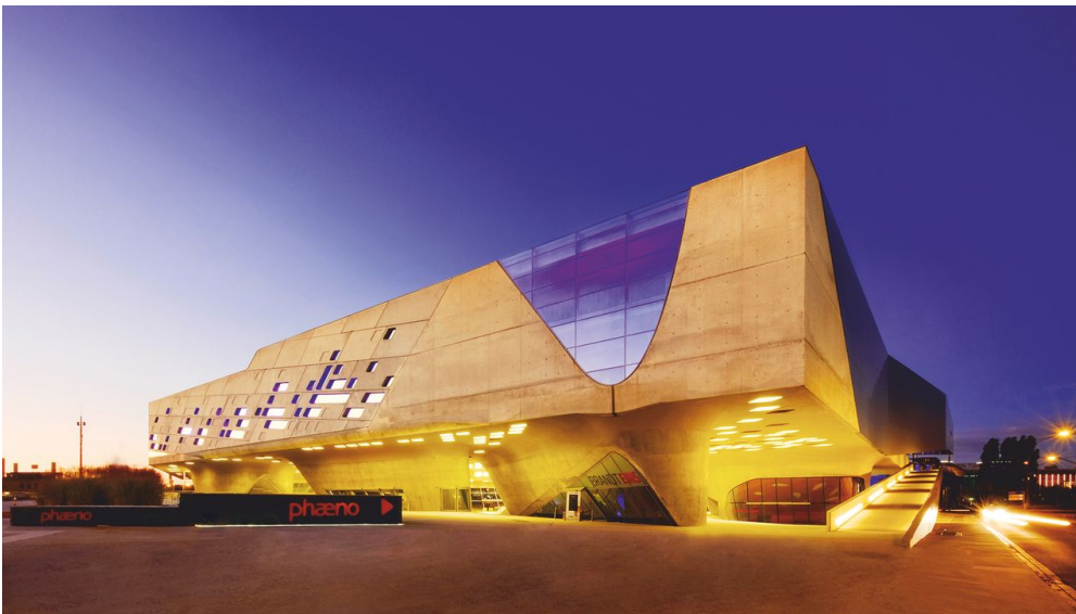
phaeno beleuchtet Außenansicht - © Janina Snatzke