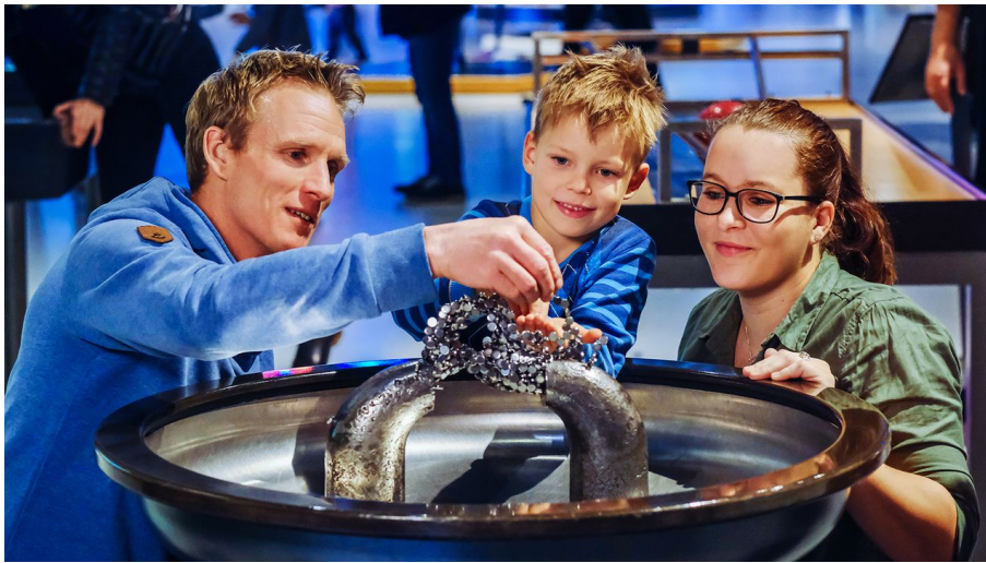
Magnetischer Sand im phaeno