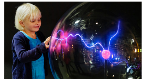
Plasmakugel mit Kind im phaeno