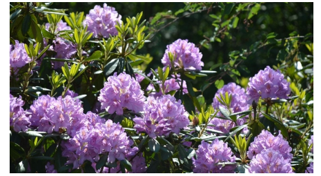
Blumen im Weltwald