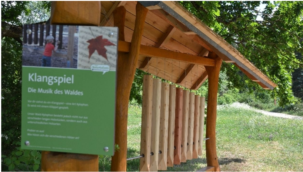
Klangspiel im Weltwald Bad Grund