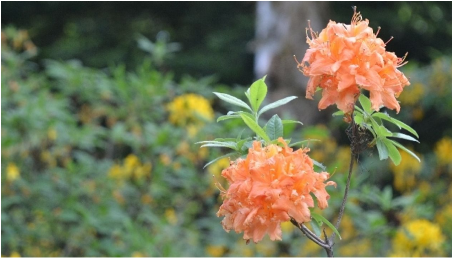
Blumen im Weltwald Bad Grund