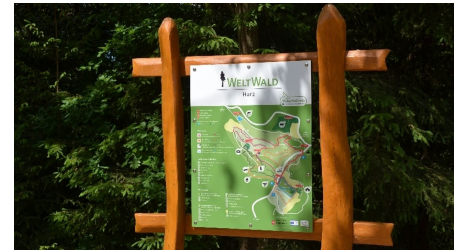
Infotafel im Weltwald Bad Grund - © Andreas Lehberg