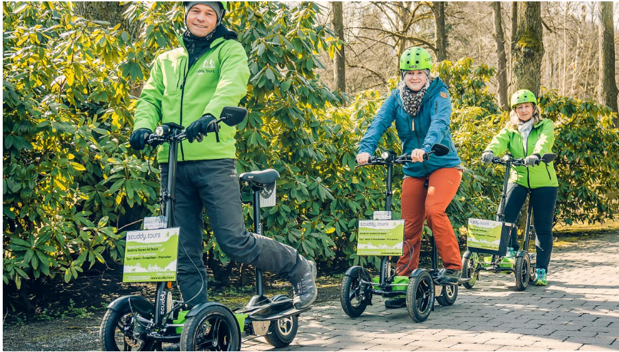
Unterwegs mit den Scuddys