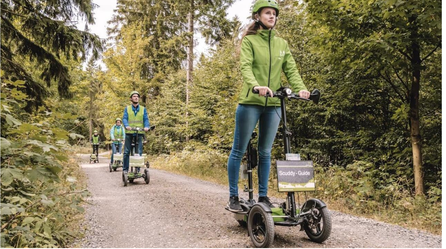
Scuddy Tours Harz