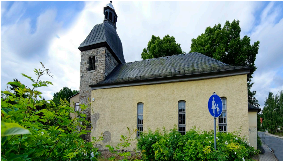
Alte Kirche in Bad Suderode