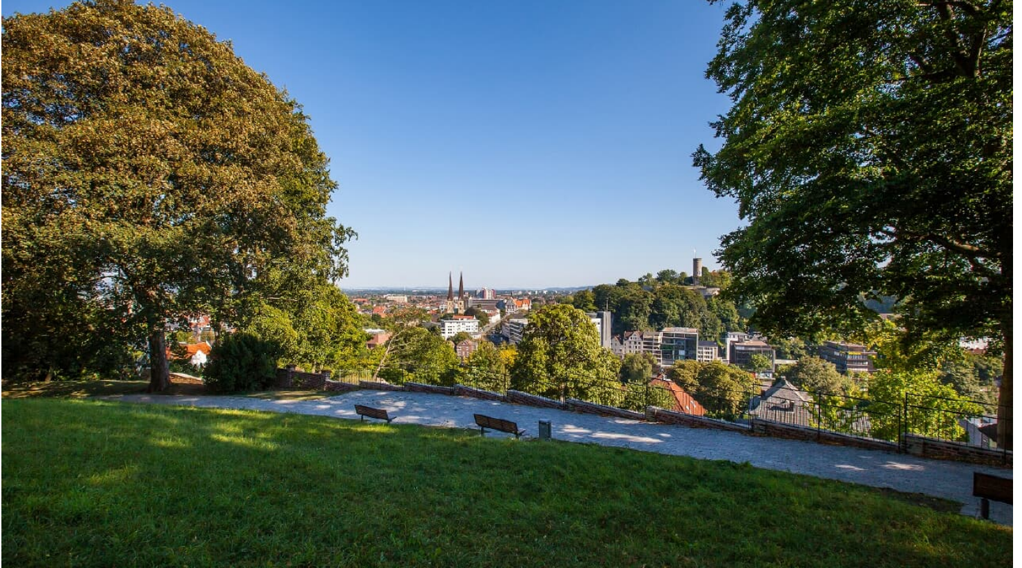
Johannisberg Bielefeld

ID: p_100049509 Zuletzt geändert am 14.07.2023, 09:00