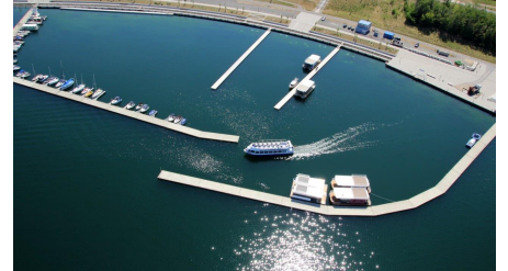
MS Geiseltalsee beim Auslaufen aus Hafen