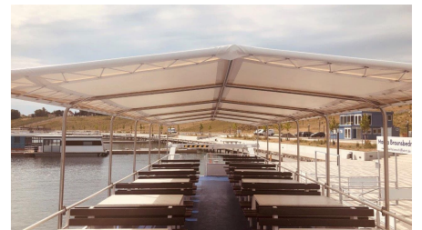
an Deck der MS Geiseltalsee