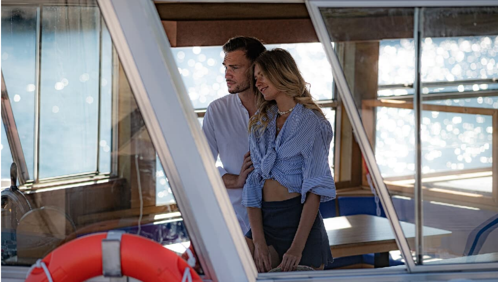
Paar auf der MS Geiseltalsee.jpg