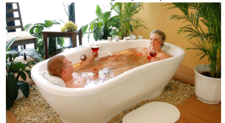
Duettbad im Wellnessbereich/naumburg_bulabana_badewanne