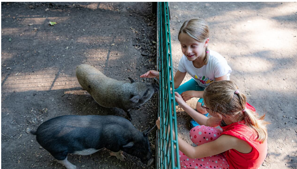
Kinder streicheln Minischweine im Tier und Erlebnispark Luetzen.jpg