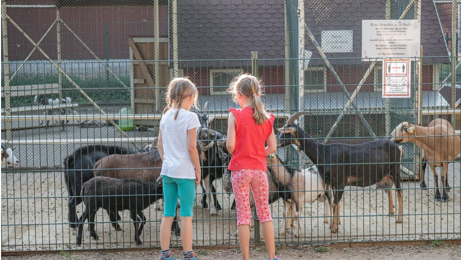
Kinder beim Fuettern von Ziegen im Tier und Erlebnispark Luetzen.jpg