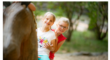
Kinder beim Spielen auf dem Spielplatz im Tier und Erlebnispark Luetzen.jpg