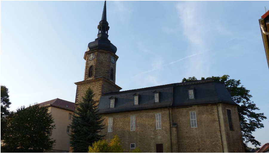
badsulza_stadtkirche - © Kurgesellschaft Heilbad Bad Sulza mbH