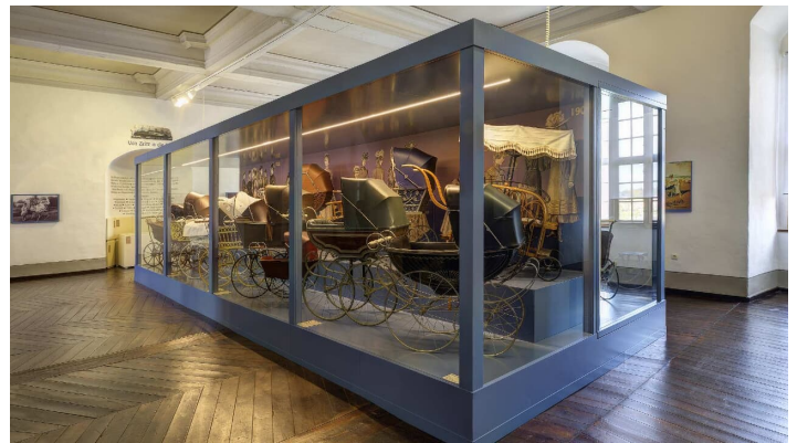
zeit_schloss_moritzburg_kinderwagenausstellung_-c-_carlo-boettger - © Carlo Böttger