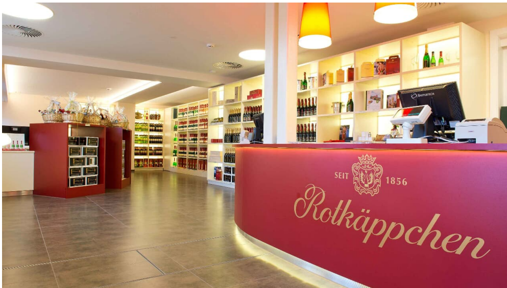
sektshop - © Rotkäppchen Sektkellerei