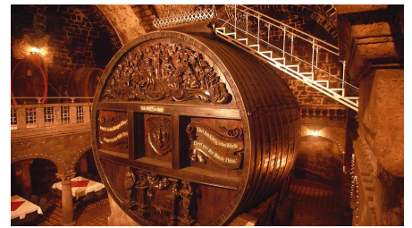
grosses-fass-im-domkeller - © Rotkäppchen Sektkellerei