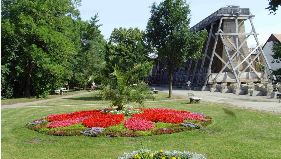
Kurpark und Gradierwerk