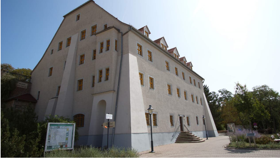
altes-salzamt_c_stadt-bad-duerrenberg - © Stadt Bad Dürrenberg