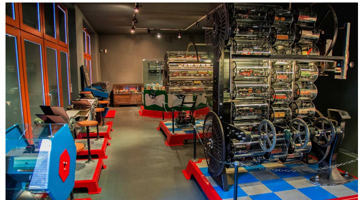
museum-petersberg-blechspielzeug_easy-resize-com - © Förderverein Erholungsgebiet Petersberg e.V.