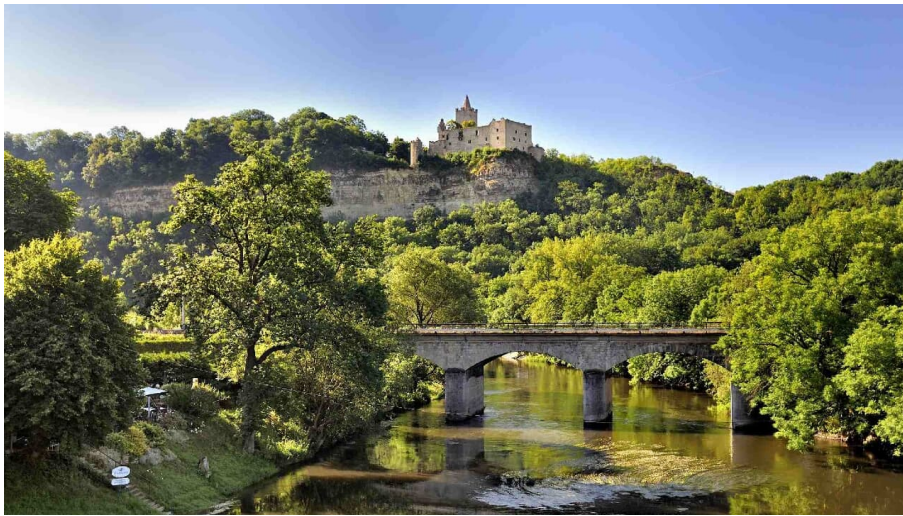
Blick zur Rudelsburg und auf Saale