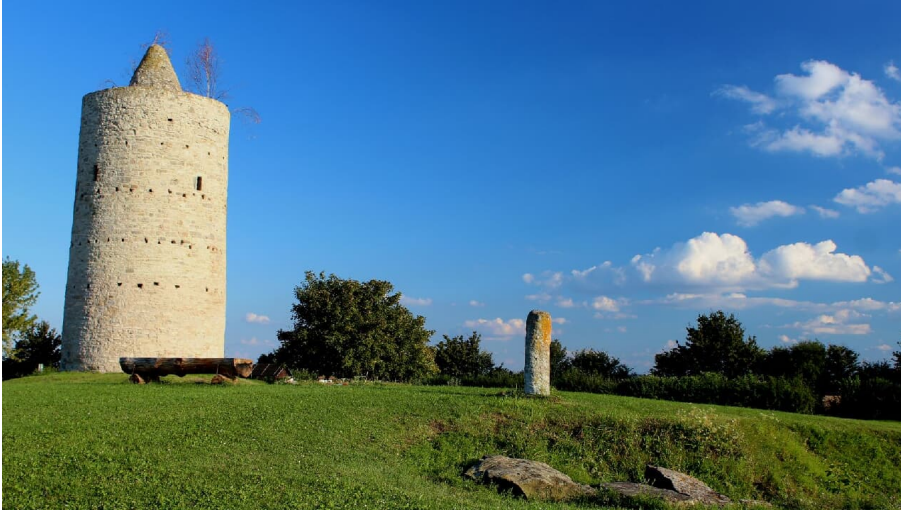
grab-der-dolmengoettin - © Dolmengöttin Langeneichstädt, Foto: E. Becher