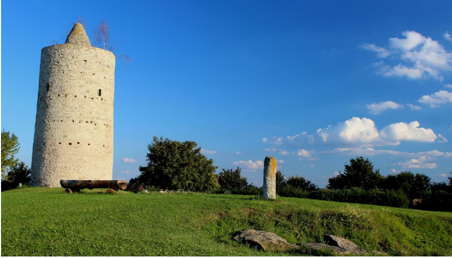
grab-der-dolmengoettin - © Dolmengöttin Langeneichstädt, Foto: E. Becher