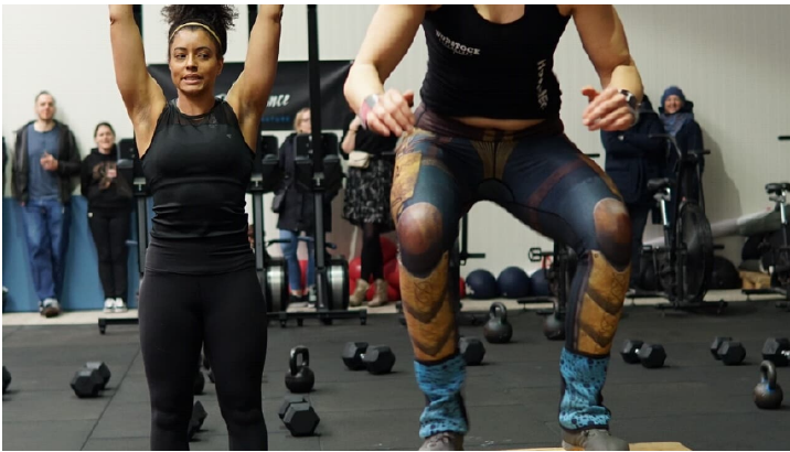
Crossfit Kasten