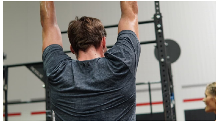
Crossfit Gewicht