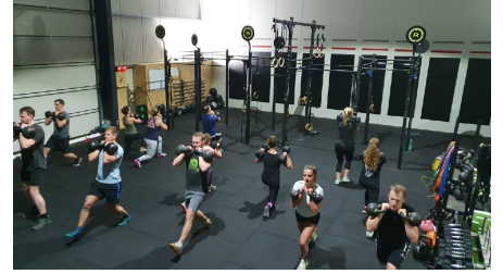
Crossfit Kettlebell