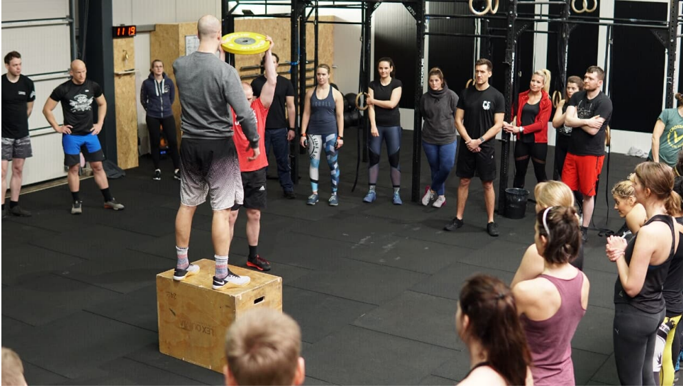
CrossFit Gruppe