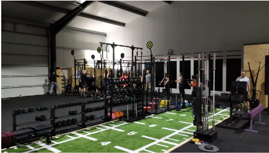
Crossfit Geräte