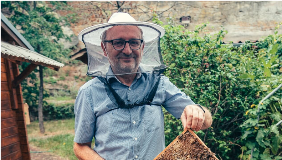
Imker im Bienenlehrgarten