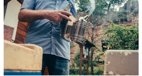
Imker macht Dampf