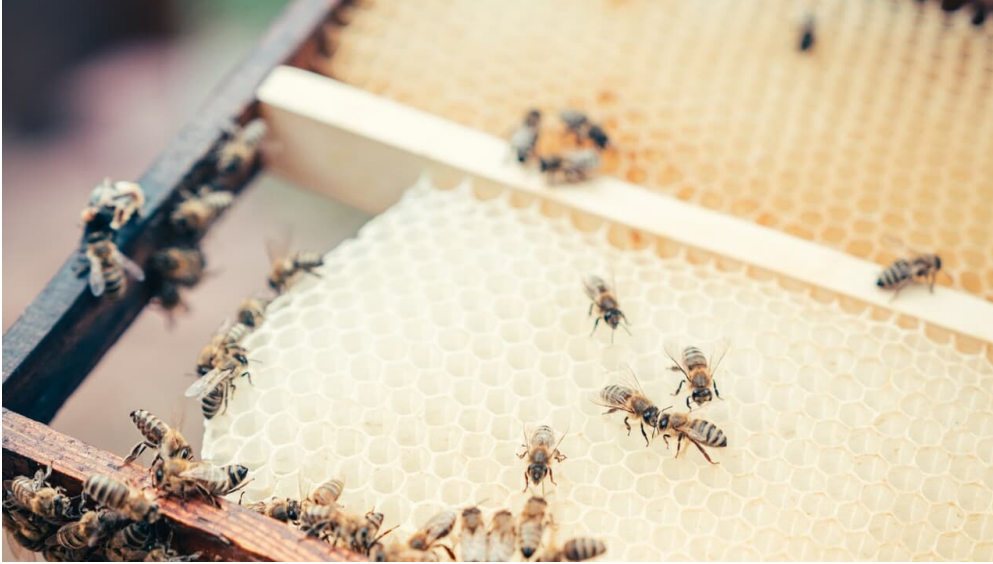
Bienenwaben - © Saale-Unstrut-Tourismus e.V.

Quelle: destination.one ID: p_100051408 Zuletzt geändert am 07.01.2021, 12:11