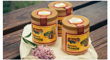
Honig aus Nebra