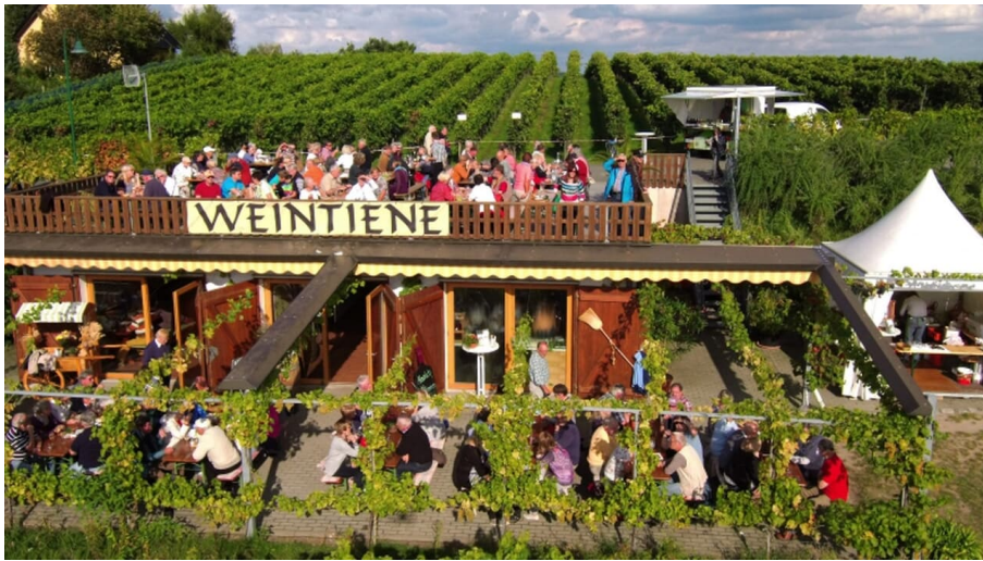
weinbau-dr-lindicke