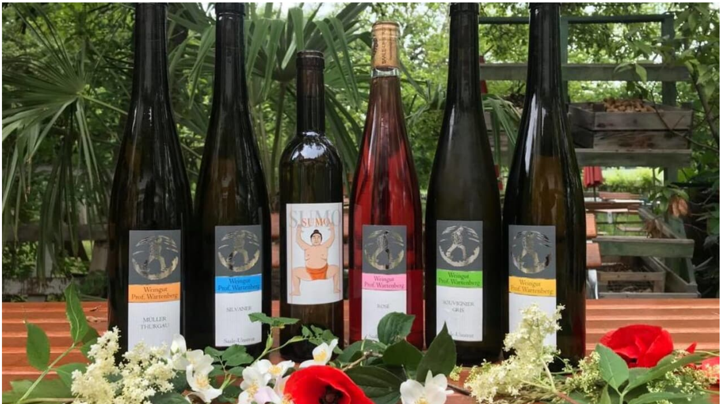
Weingut Prof. Wartenburg-Der Steinmeister.jpg