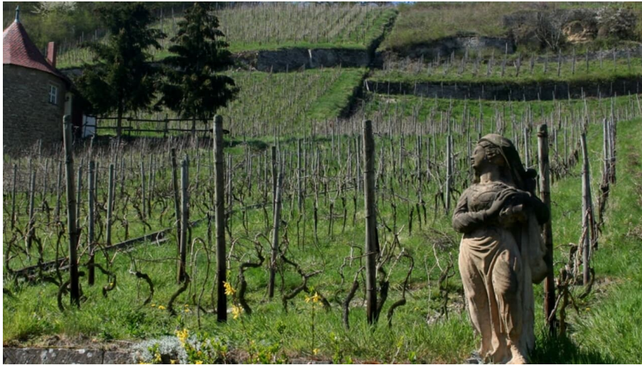
weinbau-der-steinmeister - © Weinbau Der Steinmeister