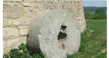
muehlstein - © Tourist-Info an der Finne