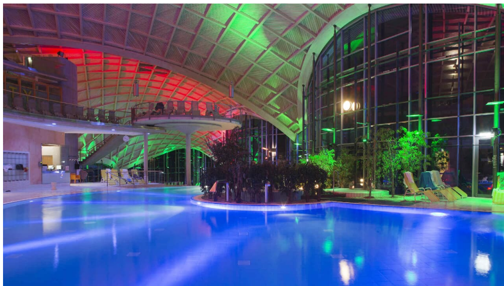
toskanatherme_innen_copyright_angela-liebich_leipzig - © Angela Liebich Leipzig

täglich 10:00 – 22:00 Uhr zum Liquid Sound Club bis 23:00 Uhr