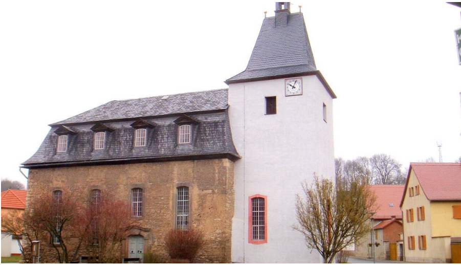
Kirche Eberstedt