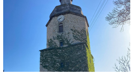
erloeserkirche mit turm