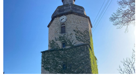
erloeserkirche mit turm