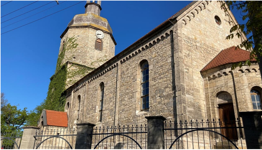
Aussenansicht erloeserkirche

im östlichen Teil Braunsbedras steht die im 11. Jahrhundert im romanischen Stil erbaute Kirche.