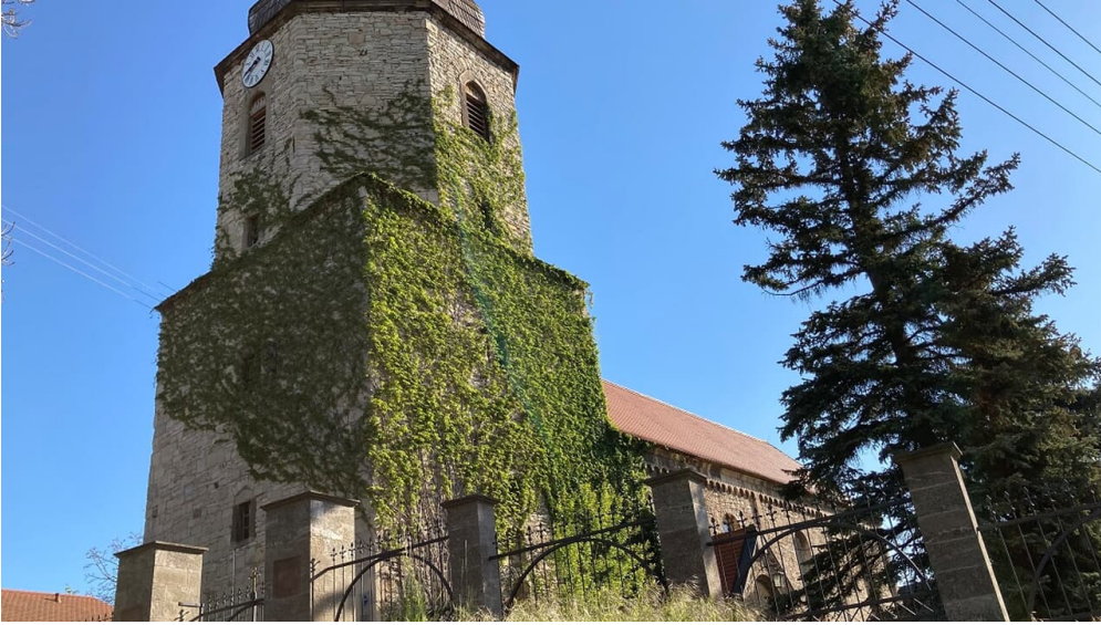
turm erloeserkirche