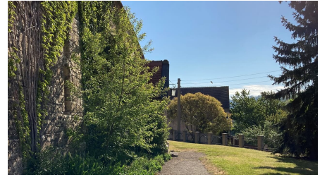
erloeserkirche aussenanlage