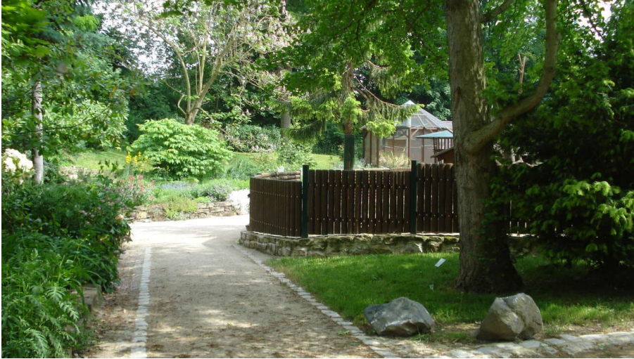
heimatnaturgarten park