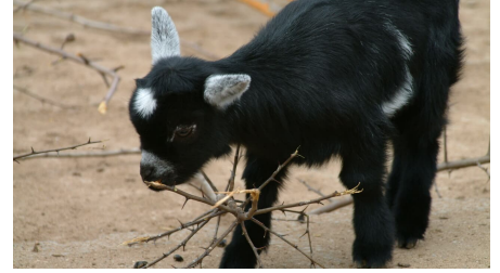
heimatnaturgarten laemmchen