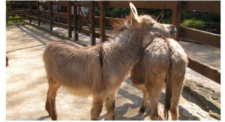
heimatnaturgarten esel