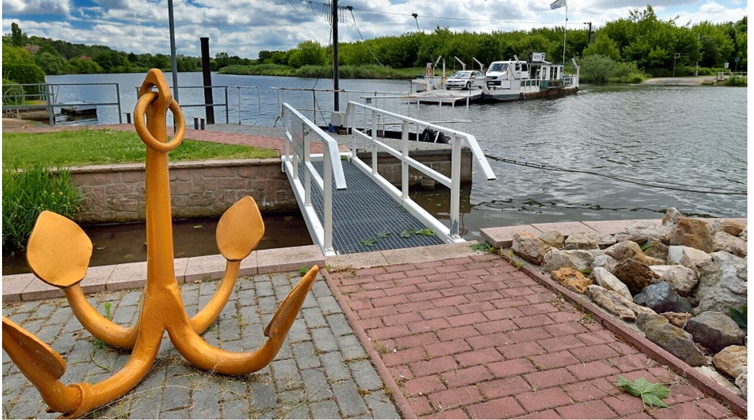
Wettin an der Saale im nördlichen Saalekreis von Sachsen-Anhalt. BR deutschland - © Wolfgang Kubak, Merseburg , Dr. Wolfgang Kubak, Merseburg