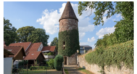
Wehrturm im Winkel