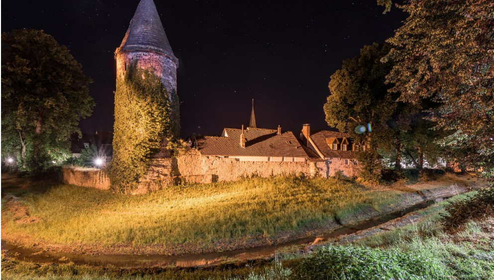
Wehrturm im Winkel bei Nacht