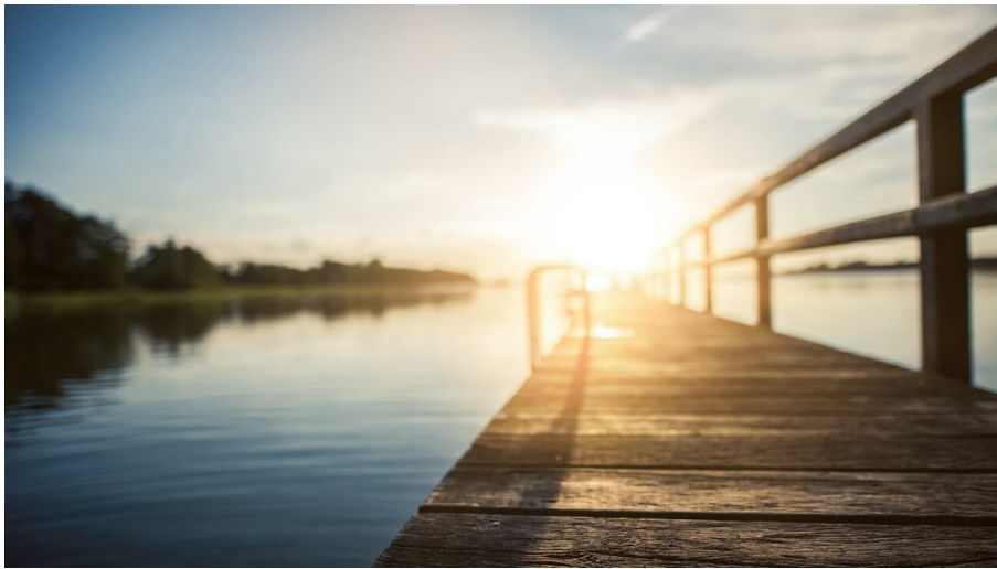
See - © Heiner