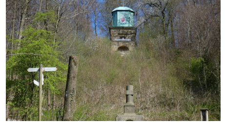
Blick auf die Kaffeemühle von der Hörstation