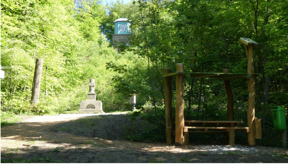
Hörstation 11 in Halle Westfalen