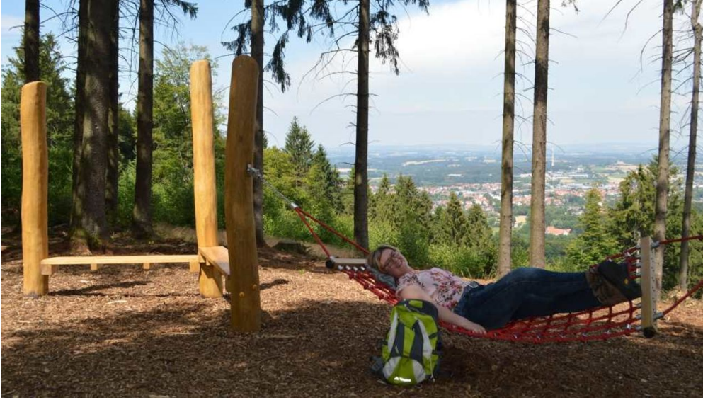
Hörstation Werther