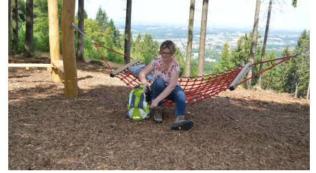
Hörstation Anna & Hermann in Werther