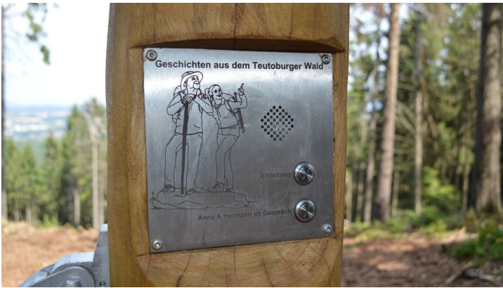
Hörstation Anna & Hermann in Werther - Lautsprecher