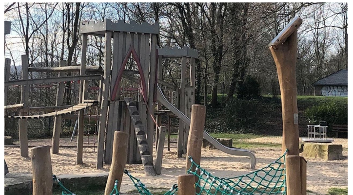
Hörstation Anna & Hermann in Bielefeld