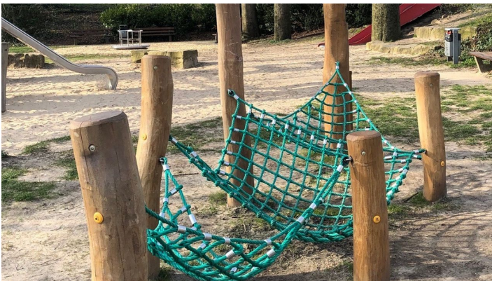
Hörstation Anna & Hermann in Bielefeld