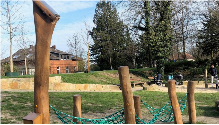
Hörstation Anna & Hermann in Bielefeld - © Bielefeld Marketing GmbH