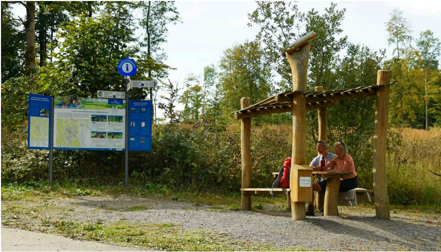
Bad Driburg-Hoerstation-Teutoburger-Wald-Tourismus-F-Grawe (32)_Klein.jpg