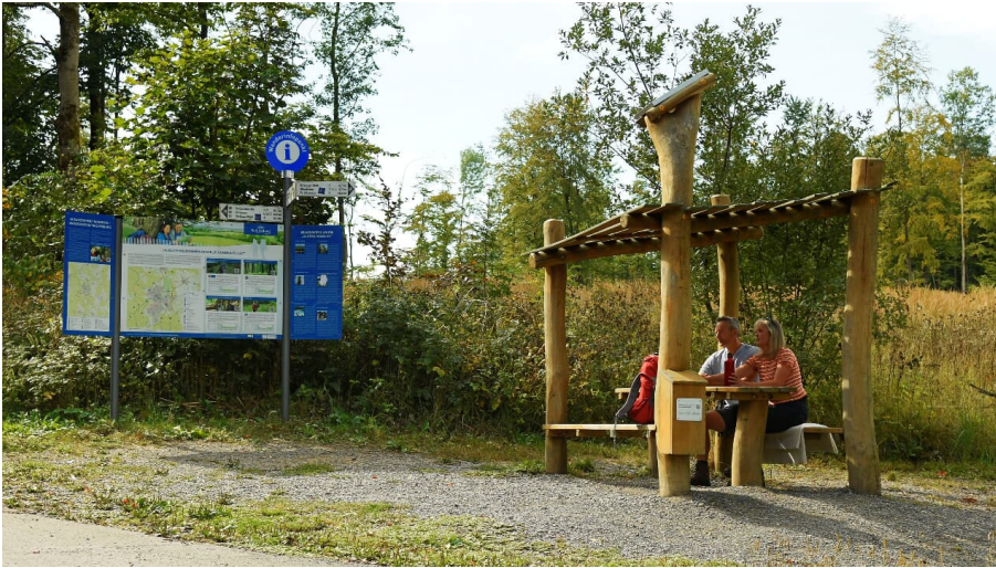
Bad Driburg-Hoerstation-Teutoburger-Wald-Tourismus-F-Grawe (32)_Klein.jpg