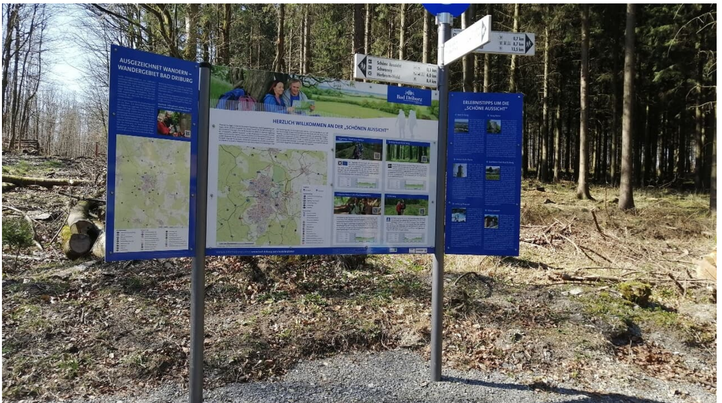
Wandertafel am Rastplatz Hermannshöhen in Bad Driburg