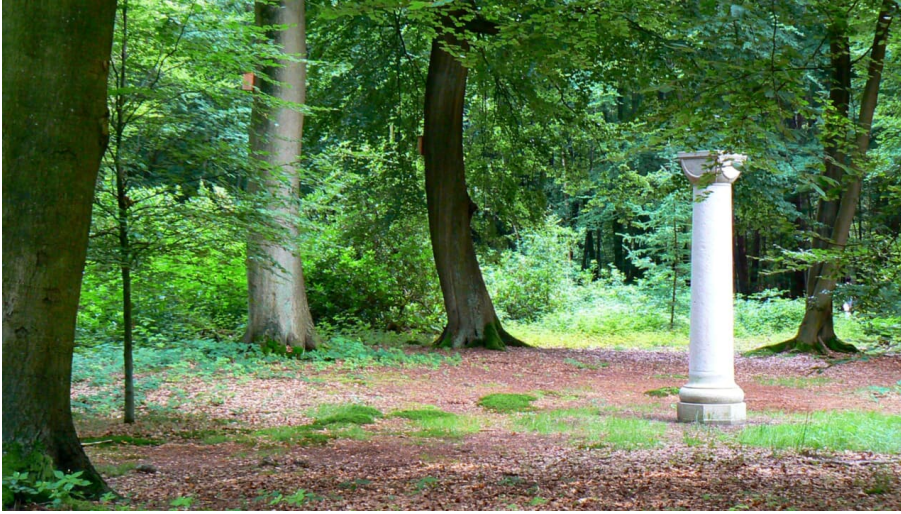
Klostersäule Sängerplatz Rastede