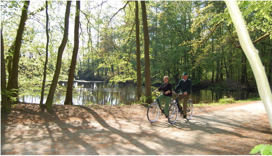
Krebsteich Schlosspark Rastede