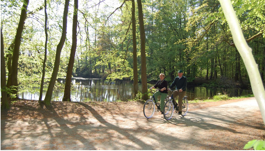
Krebsteich Schlosspark Rastede