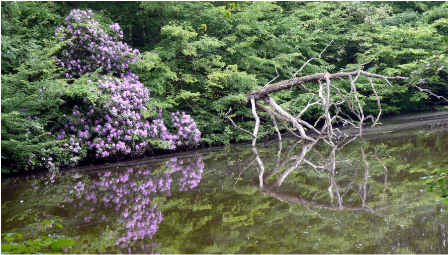
Rundteich Schlosspark Rastede