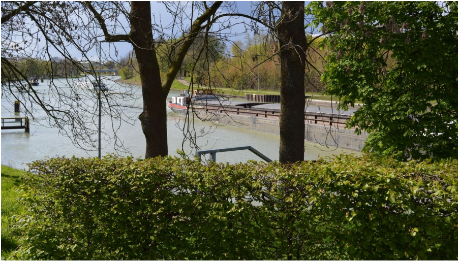
Alte Schleuse in Hörstel