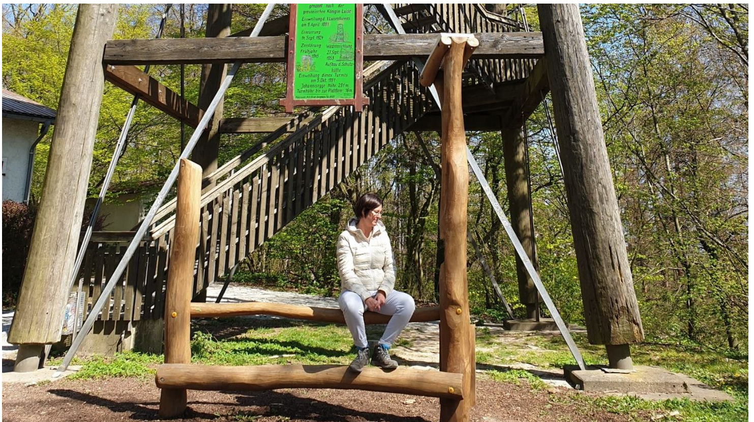
Hörstation am Luisenturm in Borgholzhausen

Voor het laatst aangepast 02.08.2024, 12:26