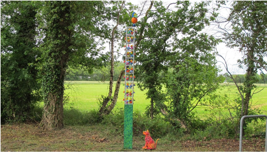
Liebingsort Schutzhütte Apermarsch