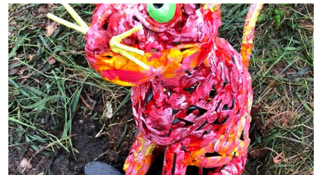
Bunte Katze am Lieblingsort Apermarsch