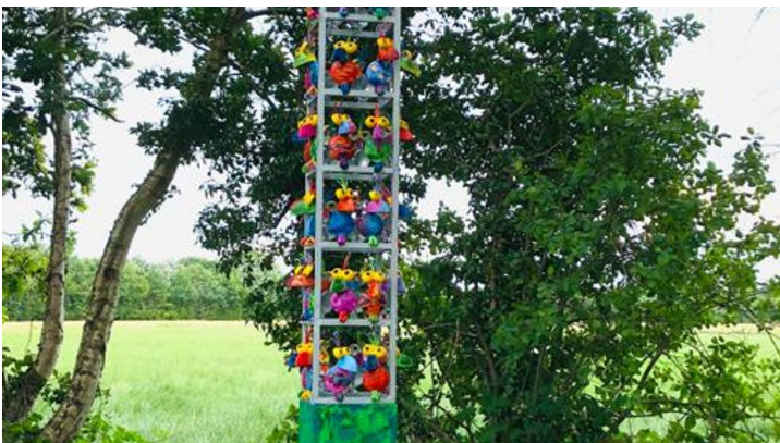
Lieblingsort mit Stele