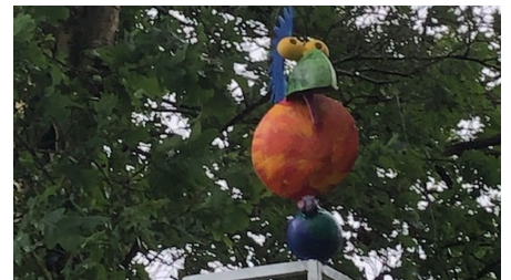
Spatz am Lieblingsort Schutzhütte Apermarsch