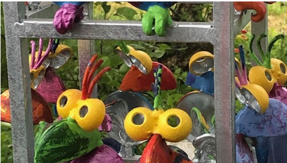
Bunte Spatzen Lieblingsort Schutzhütte Apermarsch