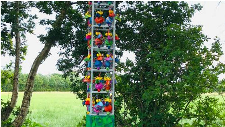
Lieblingsort mit Stele