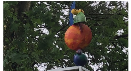
Spatz am Lieblingsort Schutzhütte Apermarsch