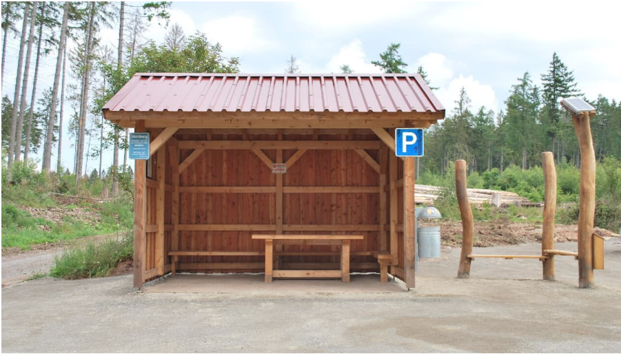
Hörstation 22 in Willebadessen