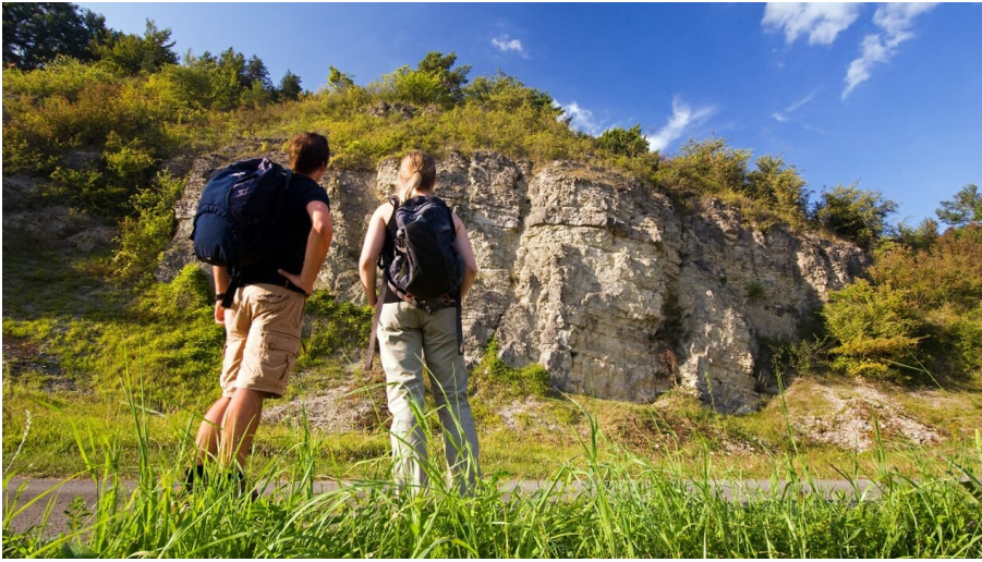
Wellenkalk am Prallhang Schwiemelkopf